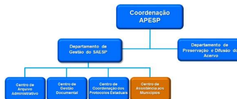
Figura 1: Organograma simplificado do CAM