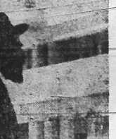
Um rabino judeu, dos muitos que se organizam para dominar o mundo.

SALAMANCA, 3 (A. B.) — O Quartel Geral comunicou: "continua a resequição do inimigo" (CONCLUE NA 3.ª PAG.)