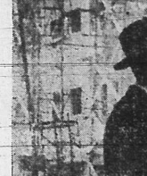
Um rabino judeu, dos muitos que se organizam para dominar o mundo.