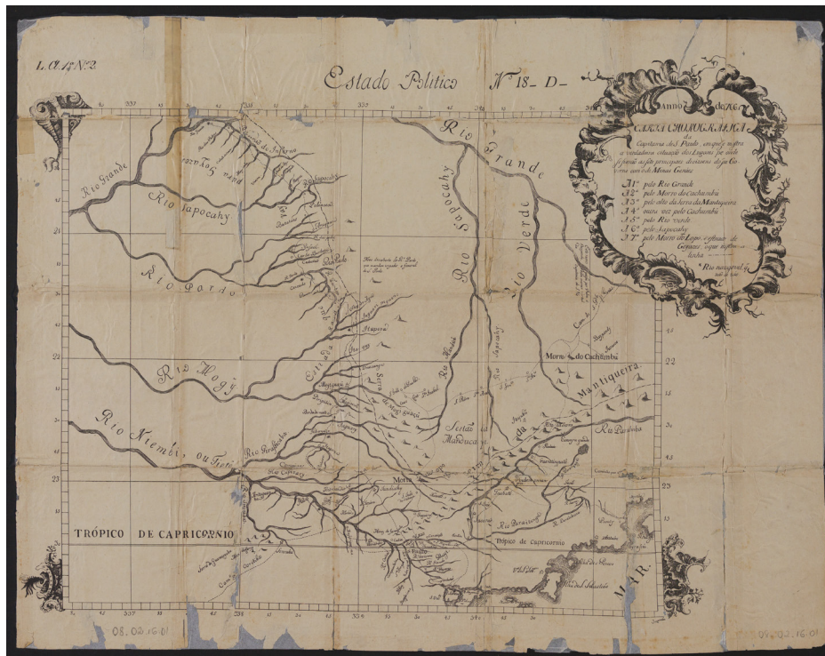
Carta Chorográfica da Capitania de S. Paulo, 1766.