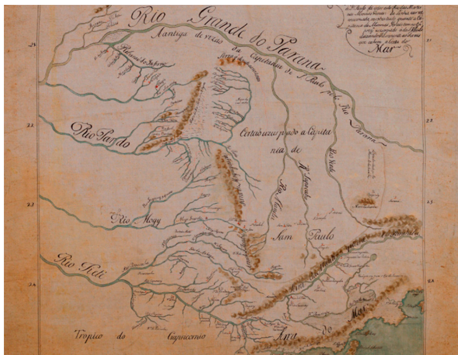
"Mappa da Capitania de S. Paulo em que se mostra tudo o que ella tinha antigamente thé o Rio Grande do Panana". 1773. Arquivo Público do Estado de São Paulo