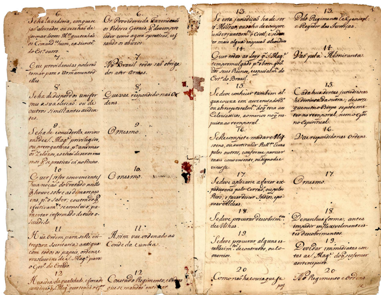
Cópia de QUESTIONÁRIO elaborado por Dom Luis Antonio e entregue ao Conde de Oeiras, com as respostas que o rei "ditara de sua própria voz" e que foram escritas pelo ministro de Estado. São vinte e cinco perguntas sobre o que "Quer saber o Governador de São Paulo pelo que respeita ao Estado", como por exemplo se deveria dedicar-se às expedições pelo sertão ou como deveria ser sua relação com o vice-rei, dentre outras; e cinco sobre "O que toca ao Pessoal do Governador de São Paulo" como se deveria admitir particulares à sua mesa, ou se poderia tomar alojamento em casas que foram dos padres da Companhia de Jesus. 1765).