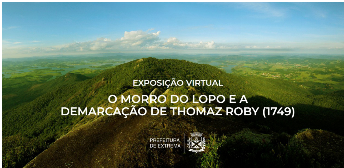
Exposição organizada por Rafaela Ferreira, na cidade de Extrema-MG

RA: Fale um pouco da sua experiência em pesquisas em arquivos.