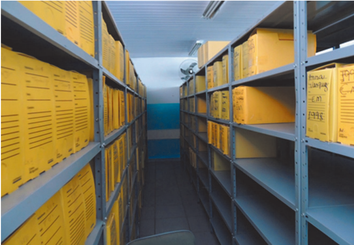
Novo local destinado à guarda da documentação