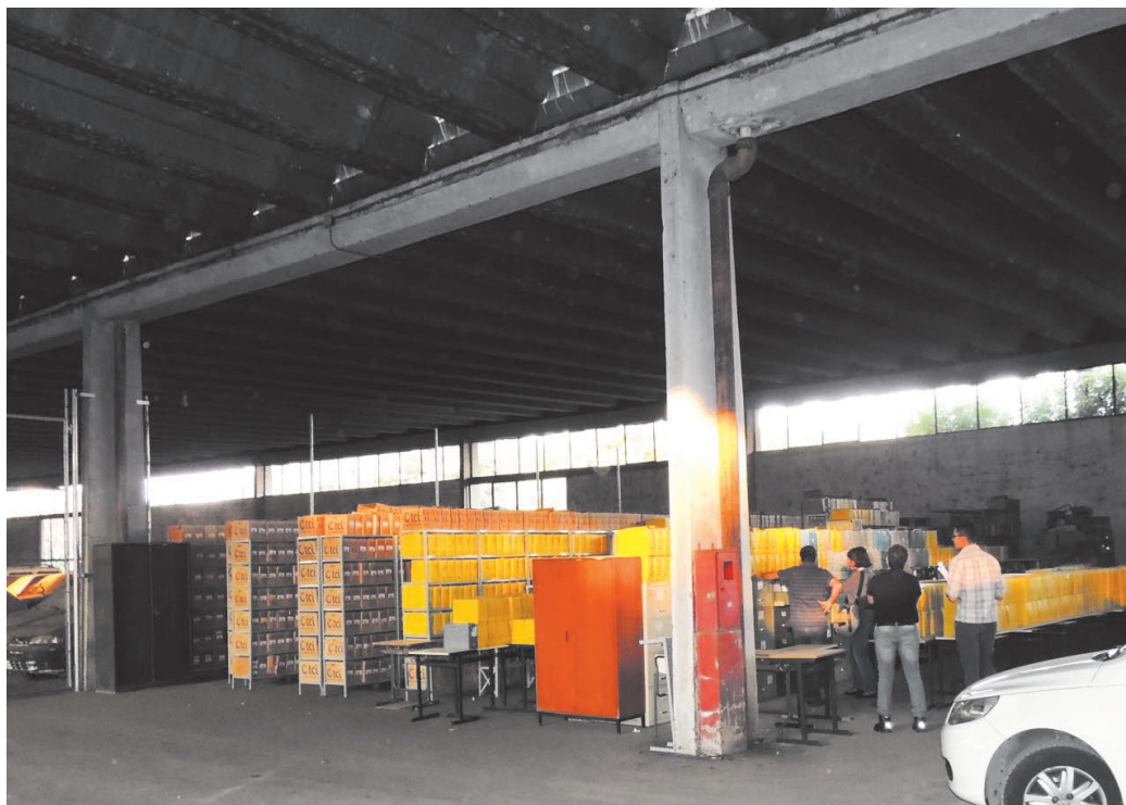
Local emergencial para onde foi remanejado o arquivo