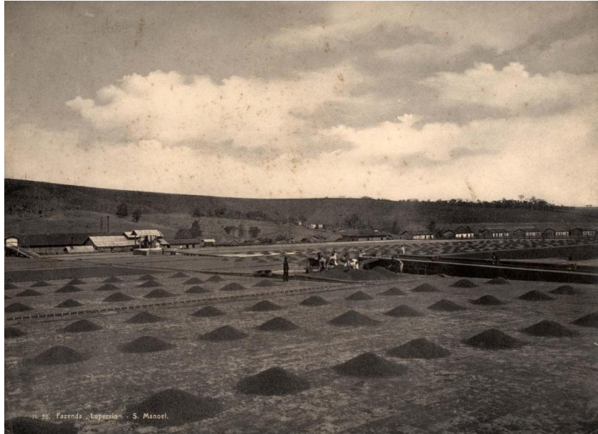
Fazenda Lupercio.