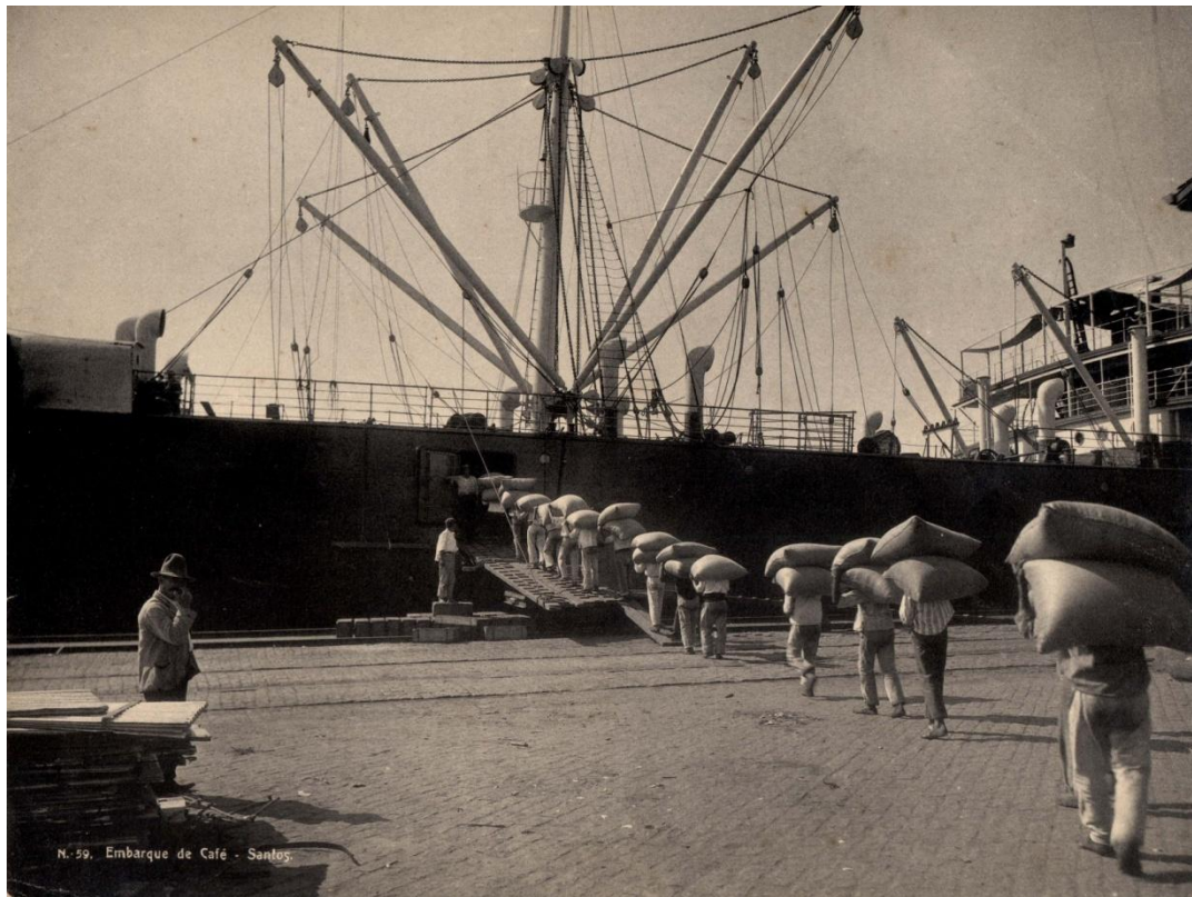
Embarque de café.