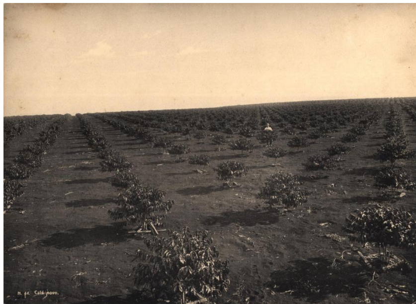
Café Novo.