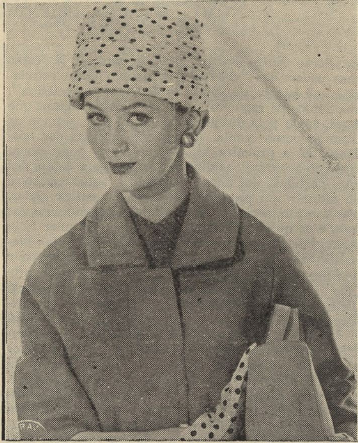
ADA GARBO sugere para este inverno