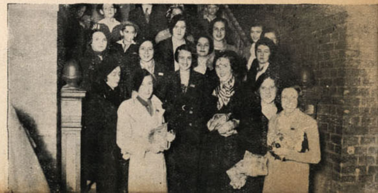
Na estação da Luz á partida do batalhão "14 de Julho", na noite de 27 de setembro