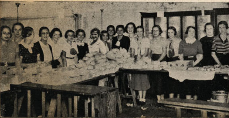
Photographia tirada no armazem central do "Lunch Expresso", á rua 24 de Maio, 2