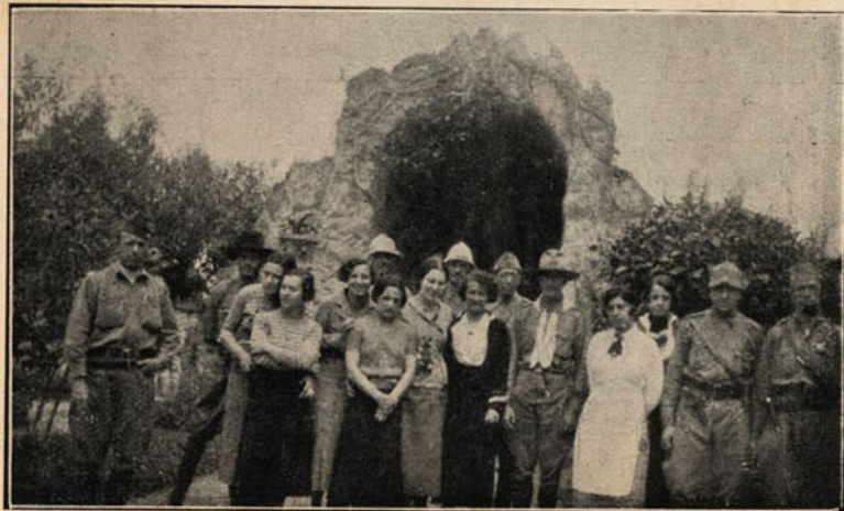
No "Repouço do Soldado", em Guaratinguetá