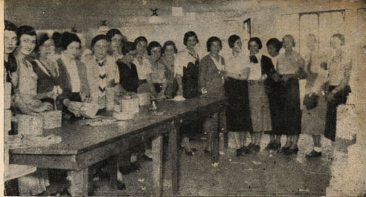
Photographia tirada no armazem central do "Lunch Expresso", á rua 24 de Maio, 2