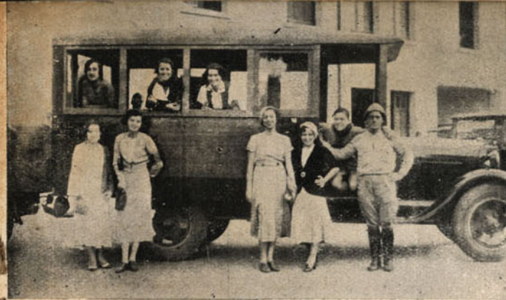
Em Quitaúna depois de uma distribuição do "Lunch Expresso"