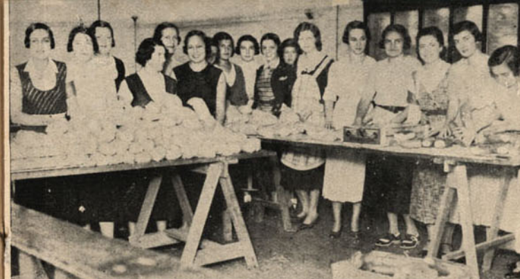
Photographia tirada no armazem central do "Lunch Express-o" à rua 24 de Maio, 2