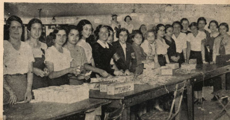
Photographia tirada no armazem central do "Lunch Express-o" à rua 24 de Maio, 2