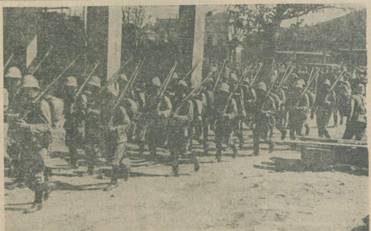
Os primeiros contingentes da valorosa Força Publica enviados para o "front".