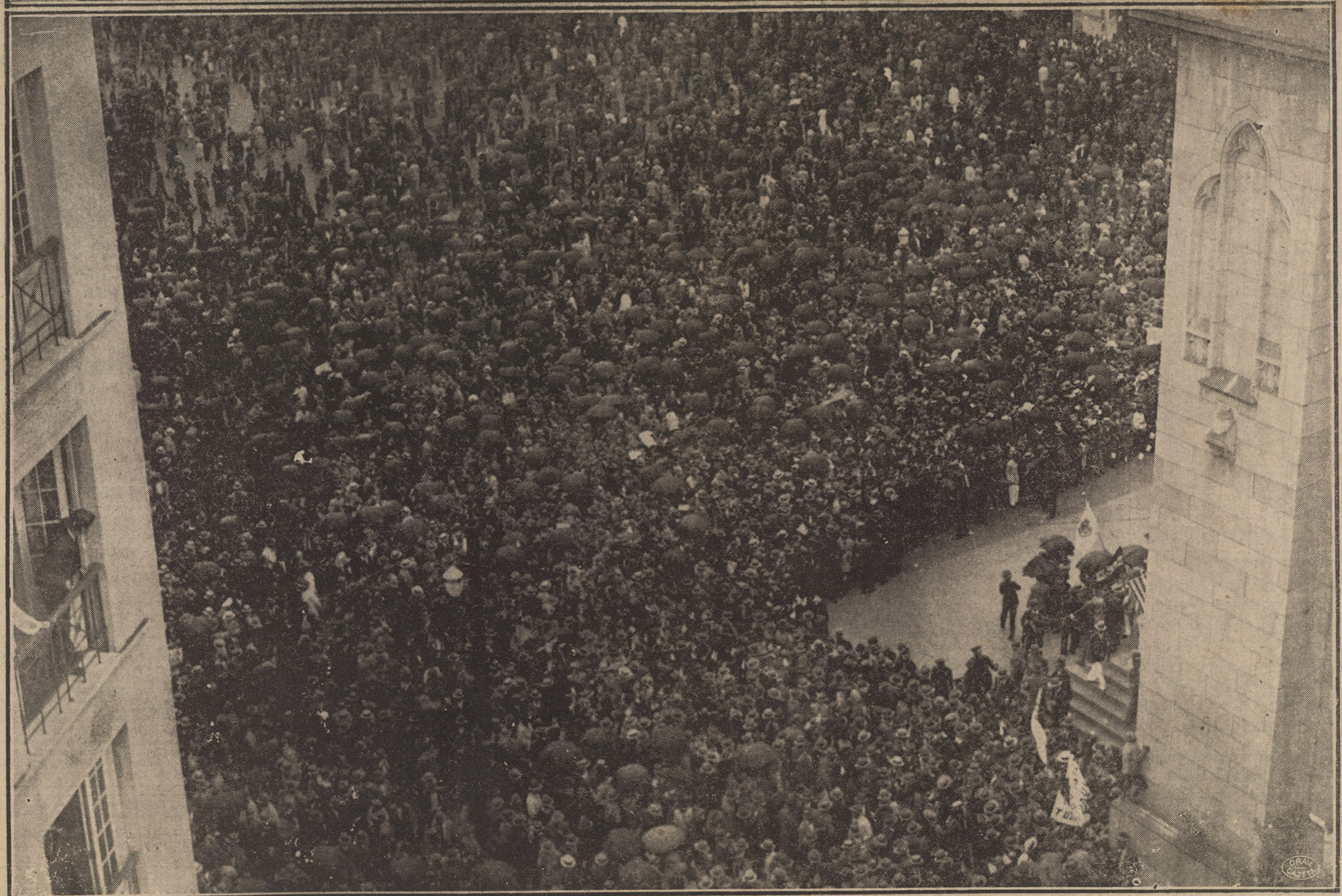
Apesar da chuva, o comicio de hontem, na praça da Sé, foi uma colossal demonstração de que a alma paulista aneia pela volta do paiz ao regimen constitucional afim de que a São Paulo seja restituída a sua autonomia